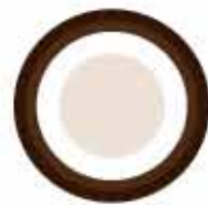
noce di cocco